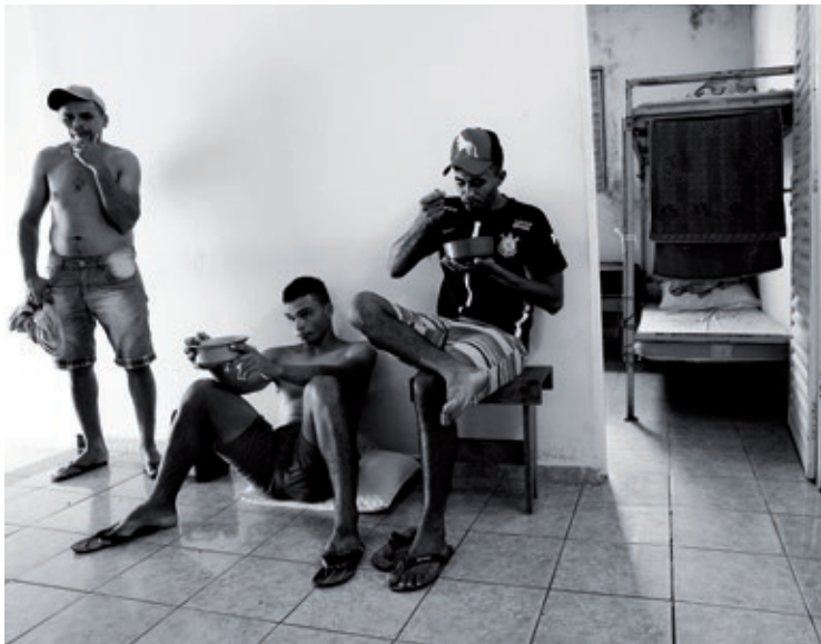
„Das Haus hat auch fast keine Möbel. Wir haben nur diese kleinen Tische. Es gibt nicht mal ein Sofa. Die sagen, wir sollen aufpassen, dass wir die Möbel nicht kaputt machen. Welche Möbel?“

zen hinweg agierenden Kapitals suchen die gewerkschaftlichen AktivistInnen des Netzwerks gemeinsamen Widerstand entgegenzusetzen. Das Netzwerk kämpft für den Erhalt öffentlicher Güter und Dienste für alle, für Beschäftigtenrechte, für eine gerechte Verteilung gesellschaftlichen Reichtums, für gesellschaftliche Transformation anstatt Herrschaft der globalen Konzerne und Finanzmärkte. Die beteiligten Gewerkschaften und Organisationen sehen sich den Prinzipien der Unabhängigkeit, Selbstorganisation und Basisorientierung verpflichtet und stellen im Gegensatz zum gewerkschaftlichen Mainstream ganz bewusst auch die Systemfrage. Über die Grenzen Europas hinaus arbeiten Basisgewerkschaften zudem im „International Labour Network of Solidarity and Struggles“ (ILNSS) zusammen, siehe auch www.laboursolidarity.org .