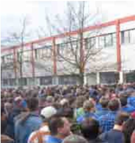
Aktion bei EVO-Bus in Ulm im März