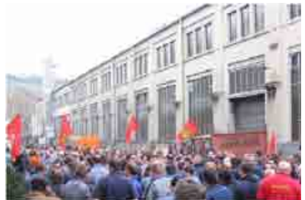
Gießereikollegen in Untertürkheim zeigen am 19.3. deutlich: Uns stinkt die ERA-Eingruppierung!

Der Lohnraub mit Hilfe von ERA ist, wie gesagt, nur ein Mosaiksteinchen. Aber viele dieser Steinchen entwickeln sich gerade zur Lawine, die auf uns und auch auf die Arbeiter anderer Länder runter zu gehen droht. Inzwischen sind es die