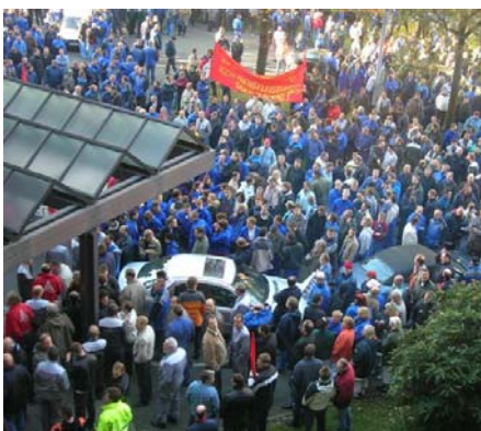
Aktion im Werk Bremen am 14.11.05

In größerem Ausmaß beweisen die Massenstreiks in Frankreich, Italien, Spanien, Griechenland, Belgien und anderswo, wie eine Mobilisierung auch bei schlechten Rahmenbedingungen möglich ist und Angriffe abgewehrt werden können.